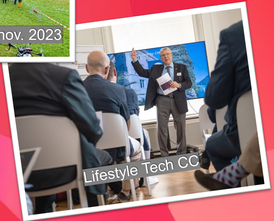
Lifestyle Tech CC