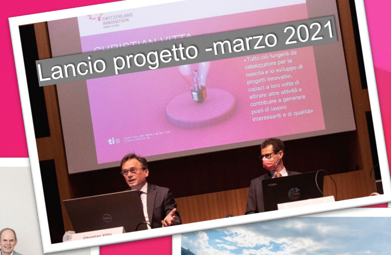
Lancio progetto -marzo 2021