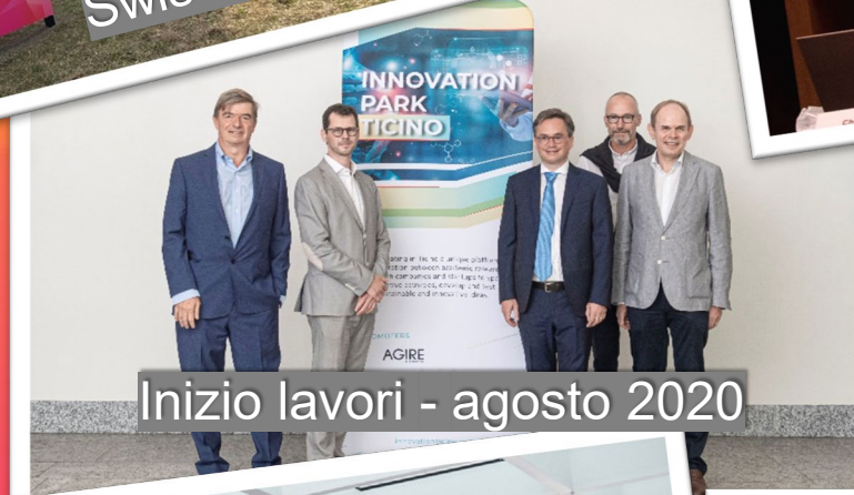
Inizio lavori - agosto 2020