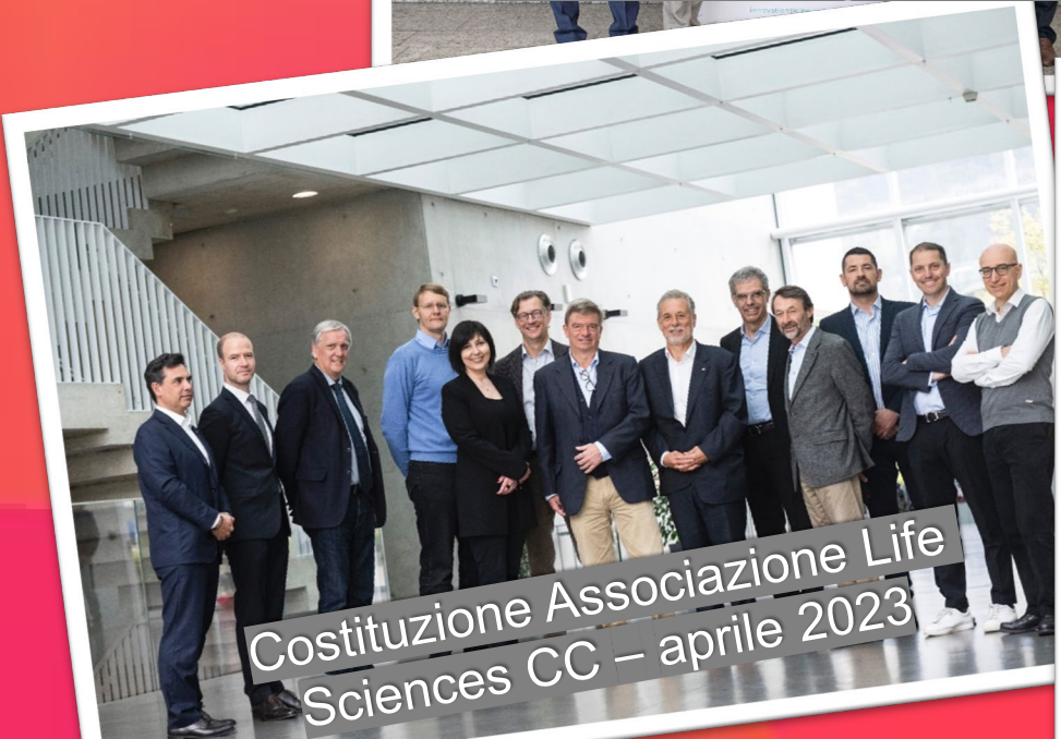
Costituzione Associazione Life Sciences CC – aprile 2023