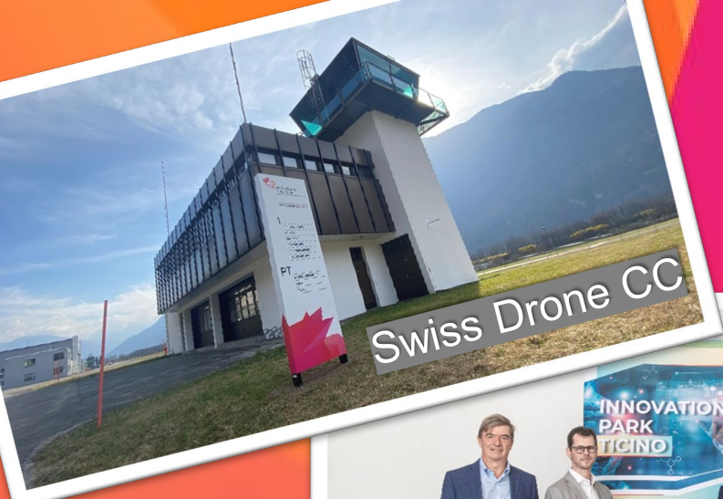
Swiss Drone CC