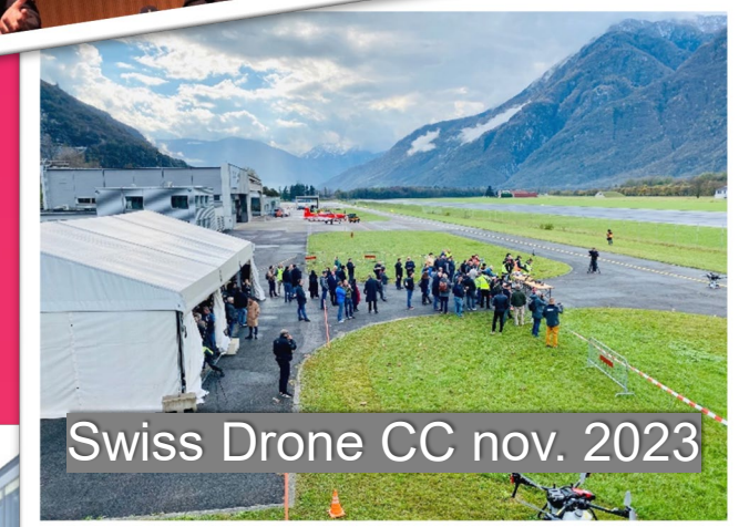
Swiss Drone CC nov. 2023