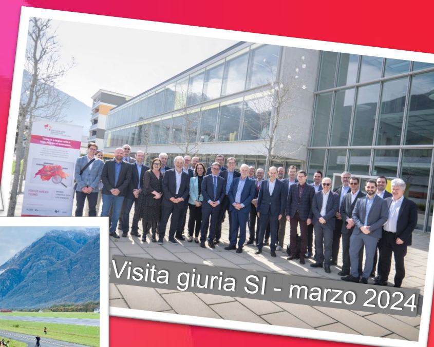
Visita giuria SI - marzo 2024